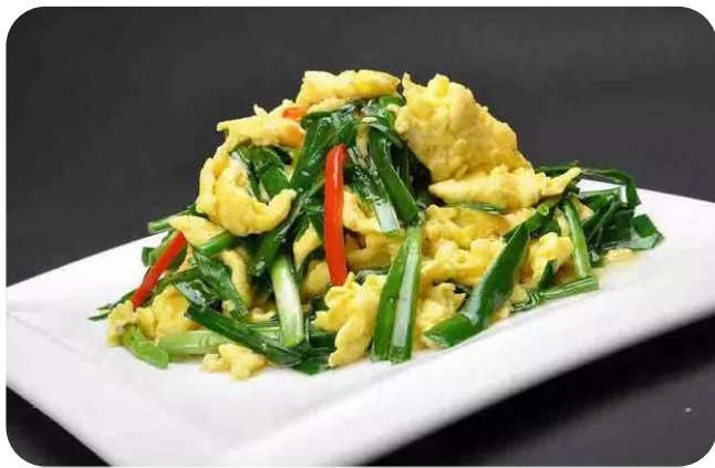
韭菜炒鸡蛋 10,00 €