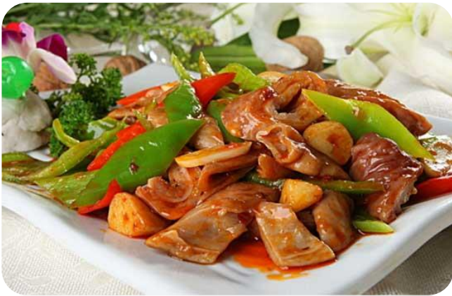
尖椒肥肠 16,00 € Schweinedarm scharf