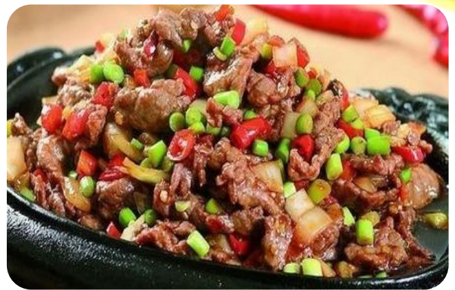
铁板孜然羊肉 17,00 € Teppan Lammfleisch mit Kreuzkümmel