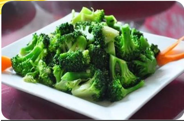
蒜蓉西兰花 10,00 €