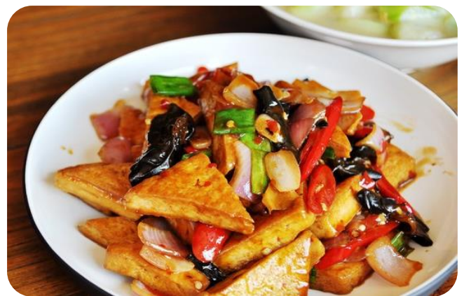
家常豆腐 10,00 €