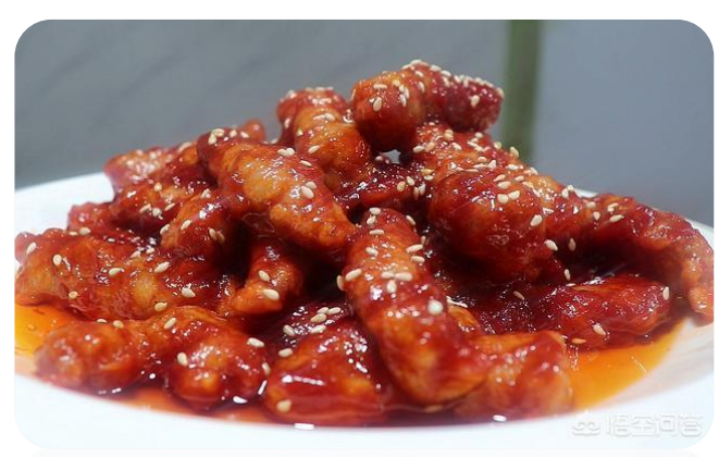
糖醋里脊肉 11,00 € Schweinefleisch süß-sauer mit Sesam