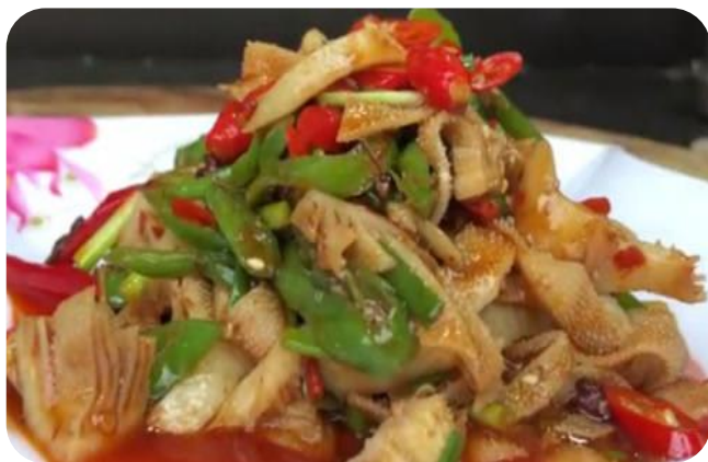
爆炒牛百叶 14,00 € Rindermagen scharf