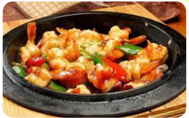
铁板虾仁 17,00 €