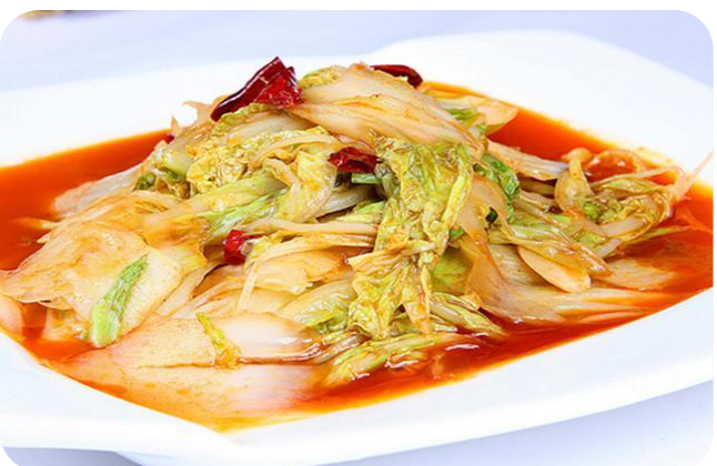
醋溜大白菜 10,00 € Chinakohl sauer scharf