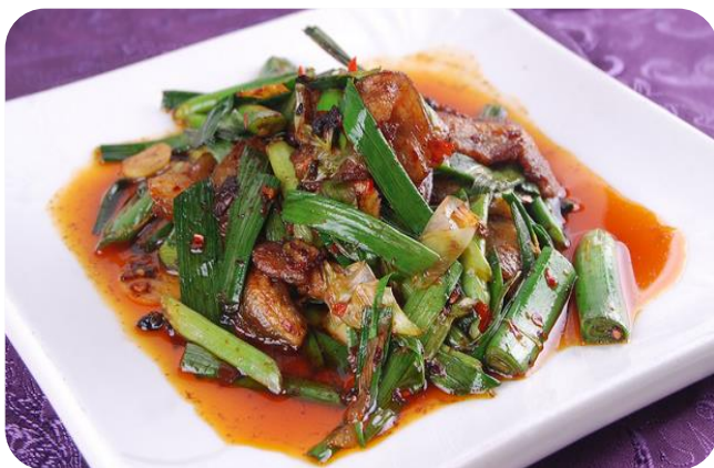
葱爆回锅肉 11,00 €