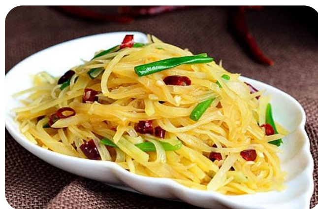
酸辣土豆丝 10,00 €