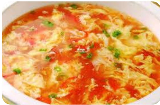
番茄蛋花汤 8,00 €