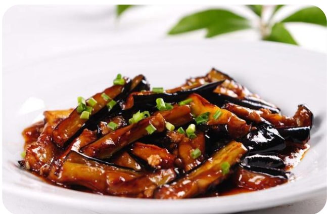
鱼香茄子 10,00 €