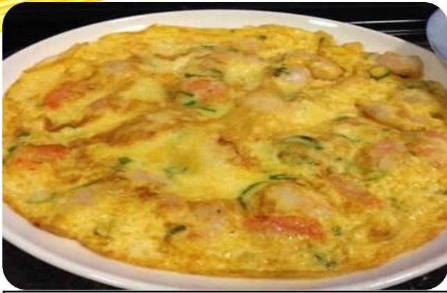
虾仁跑蛋 10,00 €