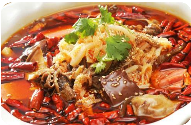
毛血旺 20,00 €