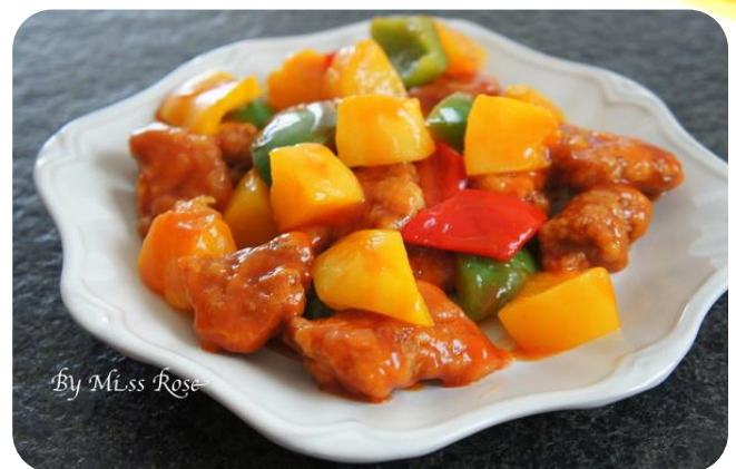
中式咕佬肉 10,00 € Schweinefleisch Süß-Sauer