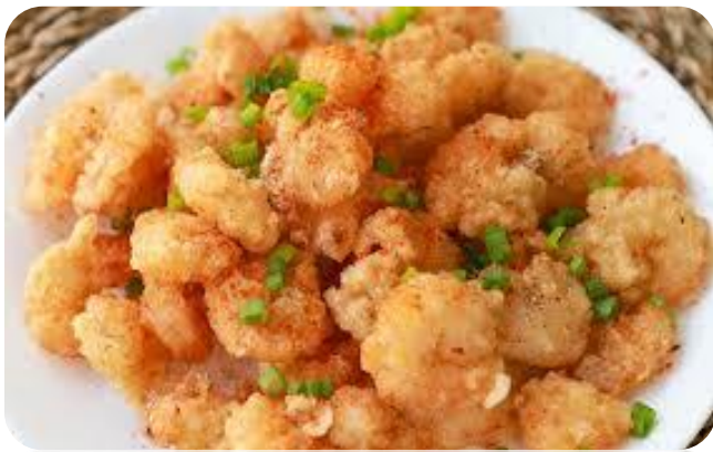
椒盐虾仁 17,00 €