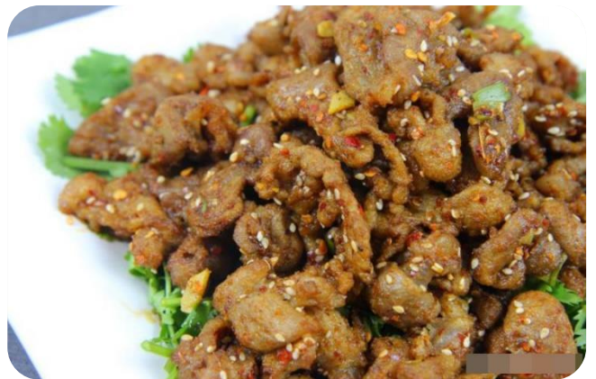
干炸孜然羊肉片 16,00 €