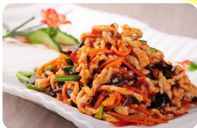
鱼香肉丝 11,00 €