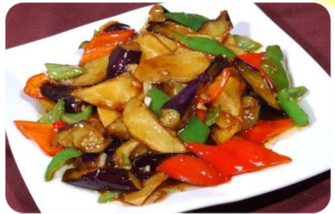
地三鲜 10,00 €