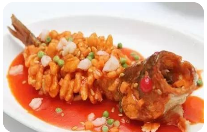
松鼠鲈鱼(提前预定) 20,00 € Wolfbarsch in süßliche Soße