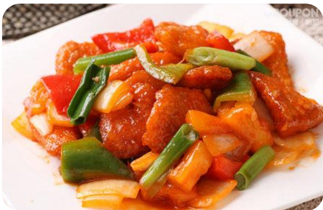
糖醋鱼块 10,00 € Fisch Süß-Sauer