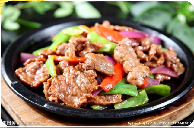
铁板牛肉 14,00 € Teppan Rindfleisch