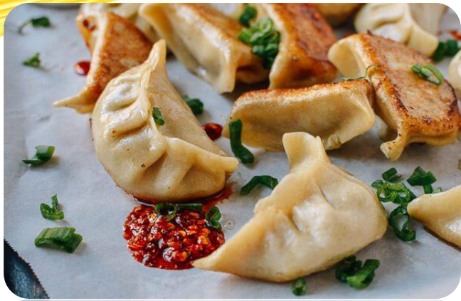
饺子 (一盘 12 个)