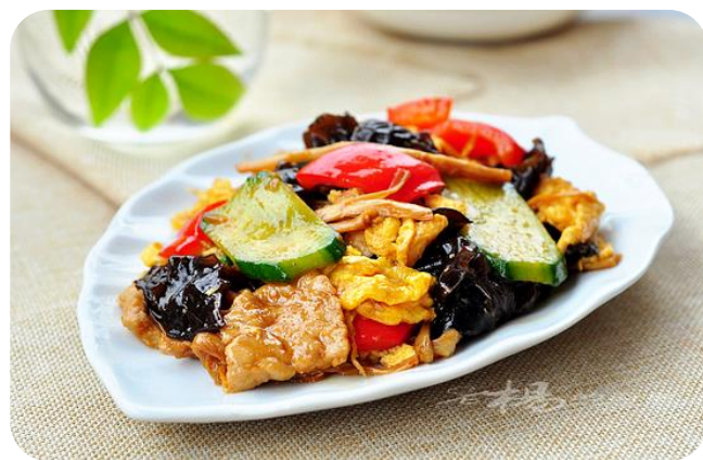
木须肉 10,00 €

Schweinefleisch mit Gurken, Ei und Morcheln