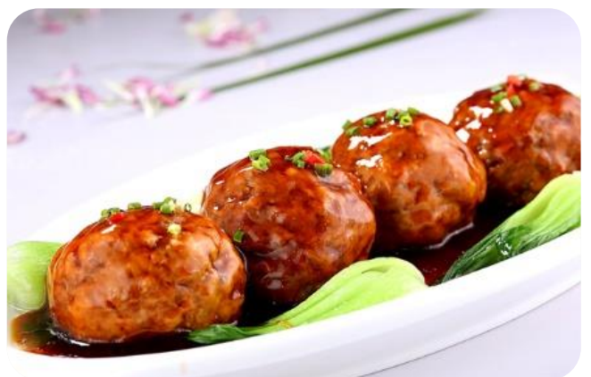
红烧狮子头 16,00 €