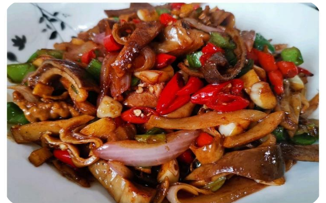
爆炒猪肚 14,00 € Schweinemagen scharf