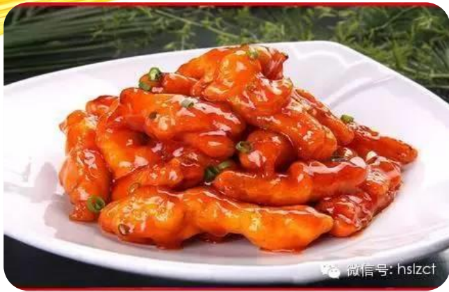
糖醋鸡柳 10,00 € Hühnerfleisch Süß-Sauer