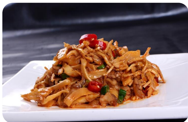
笋干炒回锅肉 13,00 €