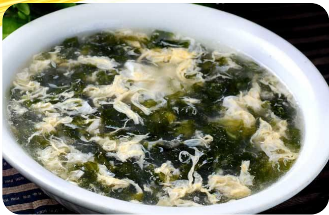
紫菜蛋花汤 8,00 €