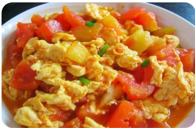
番茄炒鸡蛋 8,00 €