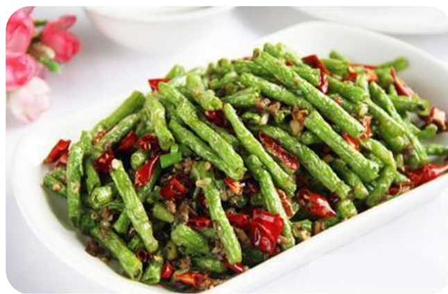
干煸豆角加肉末 10,00 €