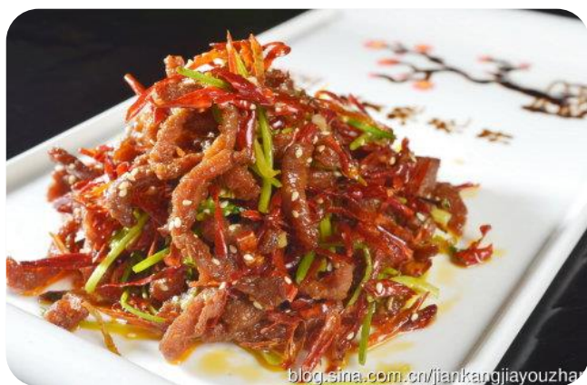
干煸牛肉丝 11,00 €