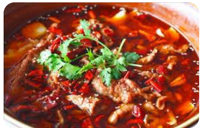
水煮牛肉 16,00 €