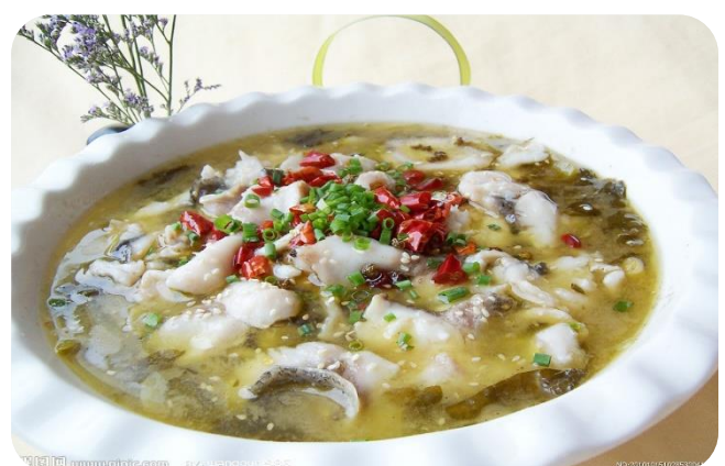
酸菜鱼 16,00 €