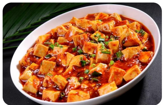
麻婆豆腐 10,00 €