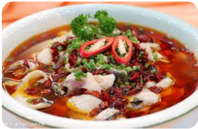
水煮鱼 16,00 €