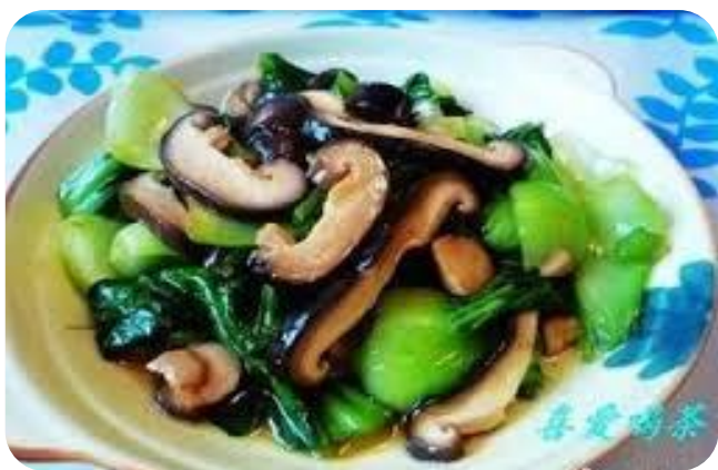
油菜炒香菇 10,00 €