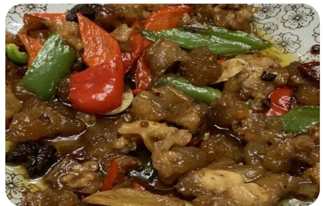
香辣牛筋 14,00 € Rindersehnen scharf