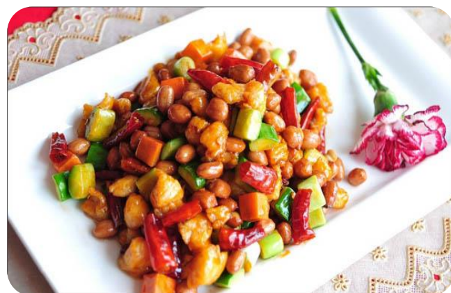
宫保鸡丁 10,00 €