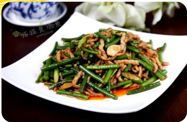
蒜苗炒肉丝 12,00 €